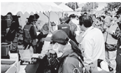
災害ボランティアセンター(長野市)