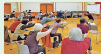
▲背筋の強化中です！