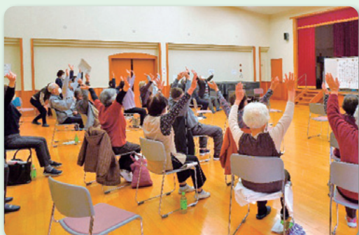
フレイル予防のためにおもいきり体をうごかします！

今後は公民館だけでなく、川原地区や西部地区でも徐々に交流会が再開されるとのこと。みんなでお茶を飲みながらおしゃべりすることは、もう少しだけ先になりそうですが、さまざまな感染対策を講じながら、区内の各所でサロン活動が無事開催されることを祈るばかりです。