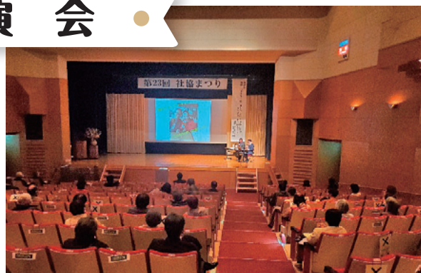
聴講者に大きな感動を与えました