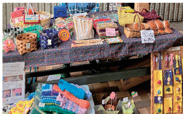
「ひまわりの家」自主製品販売