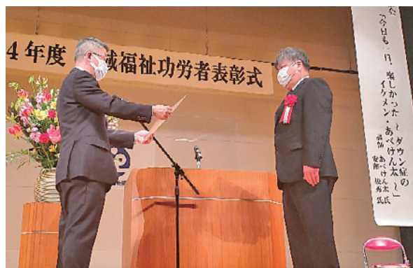
地域福祉功労者表彰式