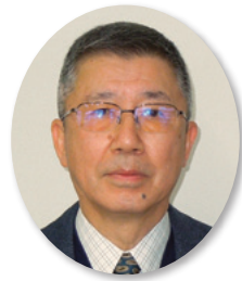
南箕輪村社会福祉協議会