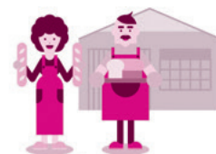
障がい者の就労支援