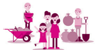
災害ボランティア支援